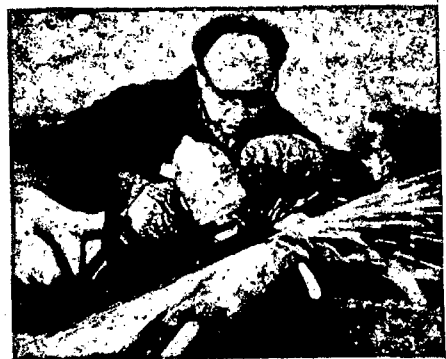
LSS-82-R-60 RECTIFICADOR O.ESMERILADOR DE COPA —