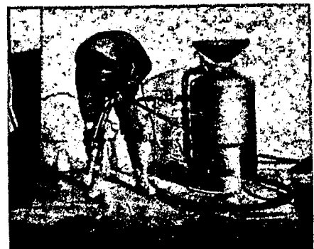
B4A-150 ARENADORA Para limpiar Depósitos, Barcos, Puentes, Edificios, etc.