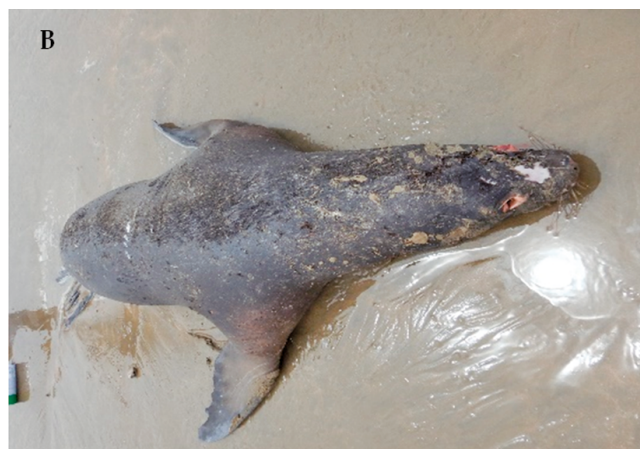
Figura 1.- Lobos marinos chuscos Otaria byronia . A) OF01: ejemplar hallado en Playa Malabrigo, La Libertad. B) OF02: ejemplar hallado en Playa San Pablo, Piura