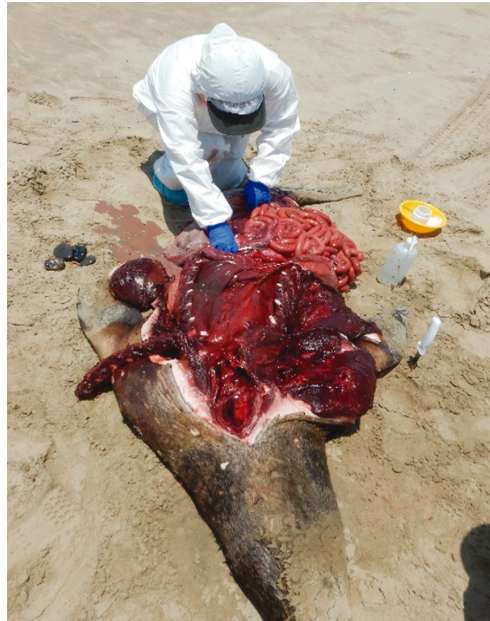
Figura 2.- Necropsias realizadas a los lobos marinos hallados en los monitoreos