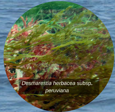
Desmarestia herbacea subsp. peruviana