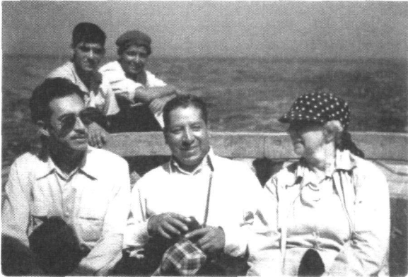
1953.- En un viaje hacia la isla Don Martín, su centro de trabajo